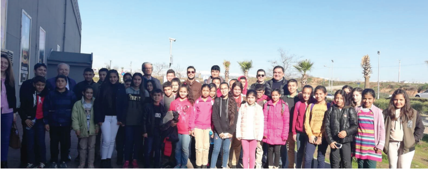
Misafirimiz Var projemizle toplam 1.316 köy çocuğunu ağırlayarak projemizi bitirdik..