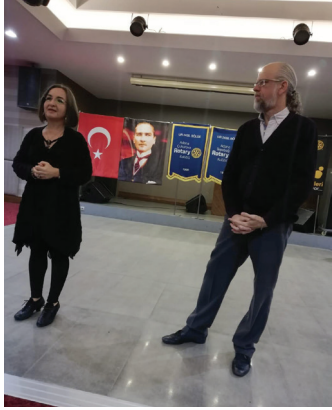
TLG projemiz gelecek hafta sona eriyor.