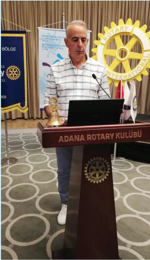
Kulübümüzü 4. Yelkenli Tekne Rally'sinde temsil eden dostlarımız getirdikleri bayrak ve flamaları kulübümüze hediye ettiler.