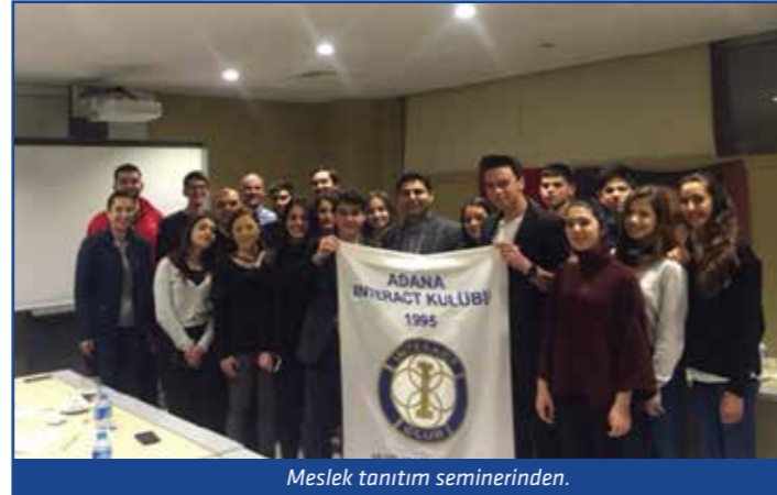
Meslek tanıtım seminerinden.