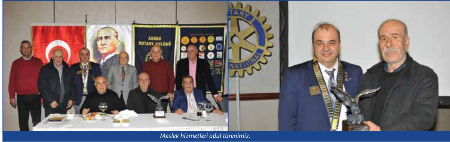
Meslek hizmetleri ödül törenimiz.