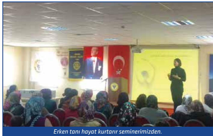
Erken tanı hayat kurtarıcı seminerimizden.