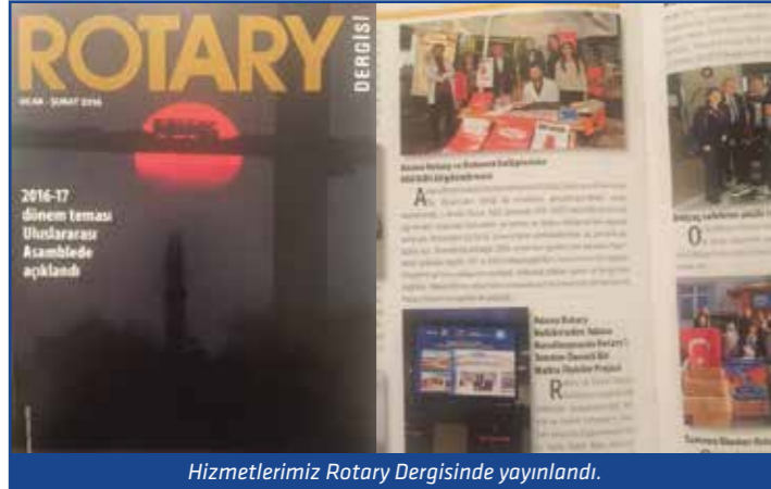
Hizmetlerimiz Rotary Dergisinde yayınlandı.