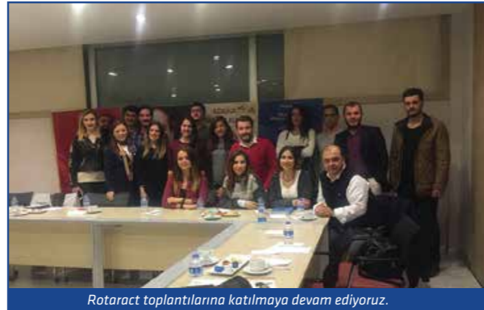
Rotaract toplantılarına katılmaya devam ediyoruz.