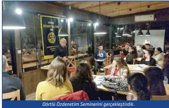
Dörtlülü Özdenetim Seminerini gerçekleştirdik.